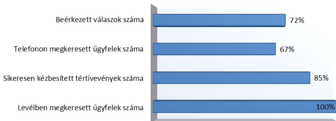
5. táblázat: A visszamenőleges visszafizetések érdekében tett intézkedések (sikerességi arány az összes érintett ügyfél vonatkozásában)

45. Az FVM az érintett ügyfelek számára küldött levelében kérte a korábban benyújtott vízigény számítások alapját képező tervdokumentációk kiegészítését a lakások pontos darabszámával és azok területének megjelölésével (m 2 ), annak érdekében, hogy az ismételt számításokat, felülvizsgálatokat elvégezhesse. A tervdokumentációs kiegészítésekkel egy időben az FVM kérte az érintett ügyfelek számlavezető pénzügyintézetének megnevezését és a bankszámlaszámuk megadását, hogy az esetleges visszautalásokról intézkedni tudjon. 29 Az eljárás alá vont adatszolgáltatása alapján összesen 150 ügyet érintett a visszamenőleges módosítás, melyben összesen 75 ügyfél volt érintett.